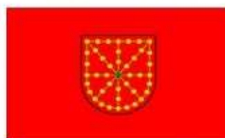
Nafarroako armarridun bandera